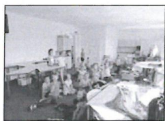
Školní družina v novém.