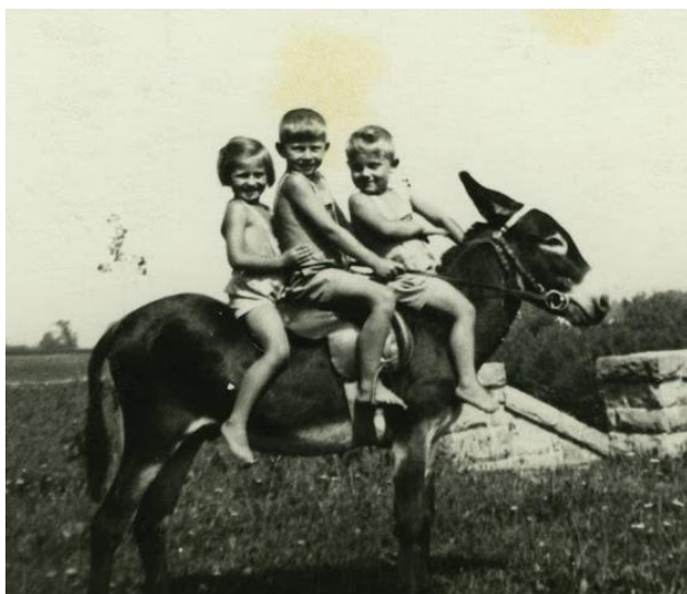
Šťastné dětství ve Stříteži