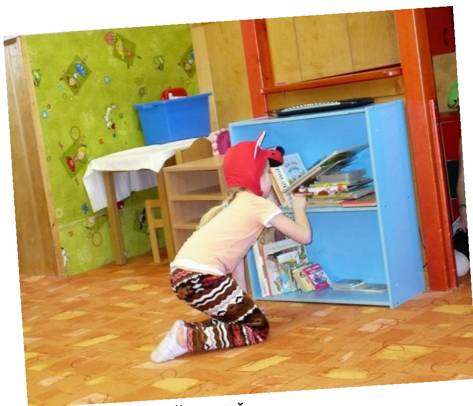
Divadlo pro MŠ