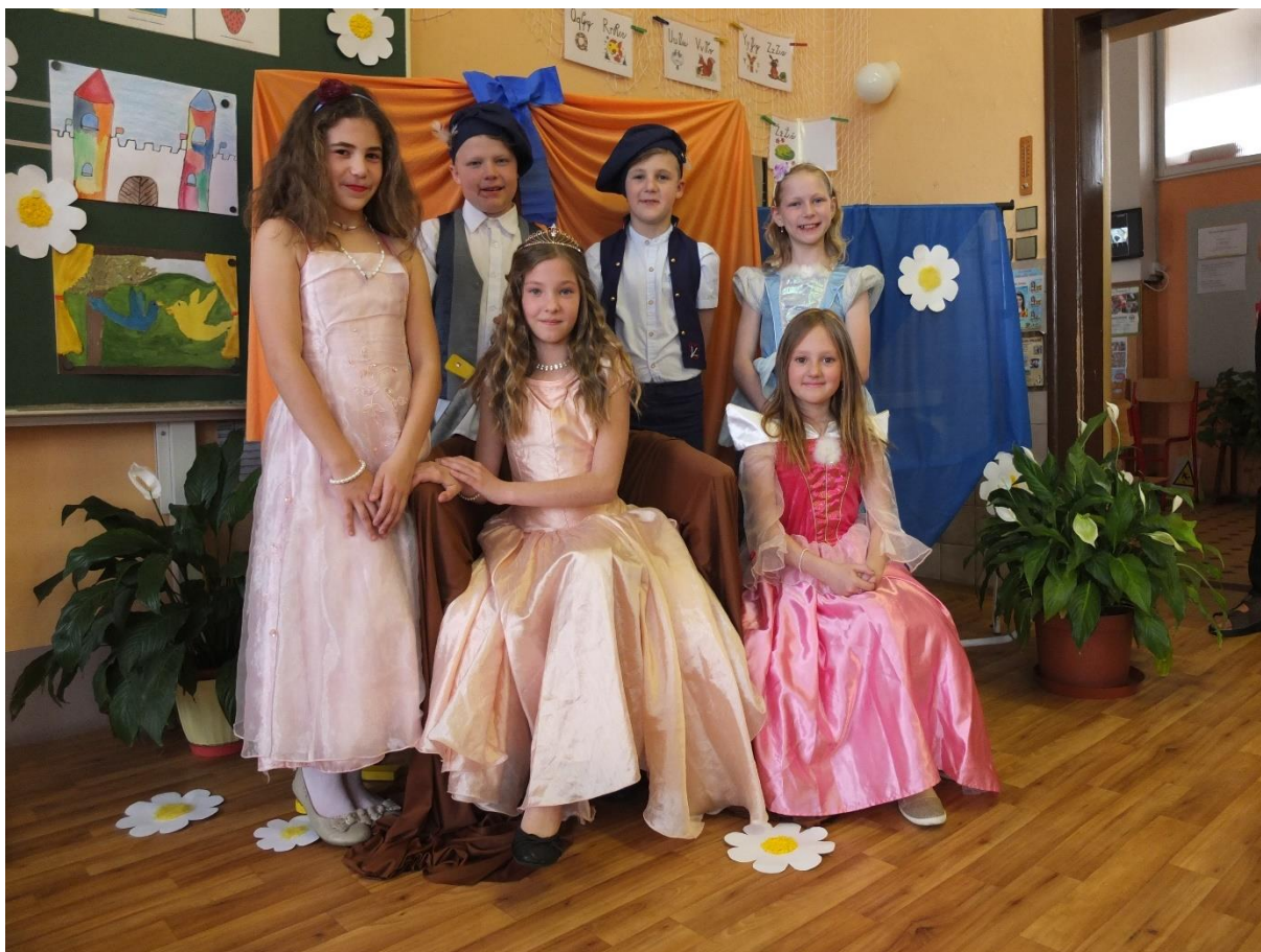
Princezny a princové z království Šípkové Růženky – průvodci budoucích prvňáčků při zápisu k základnímu vzdělávání