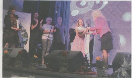
Nejlepší účinkující dostali krásné ceny.