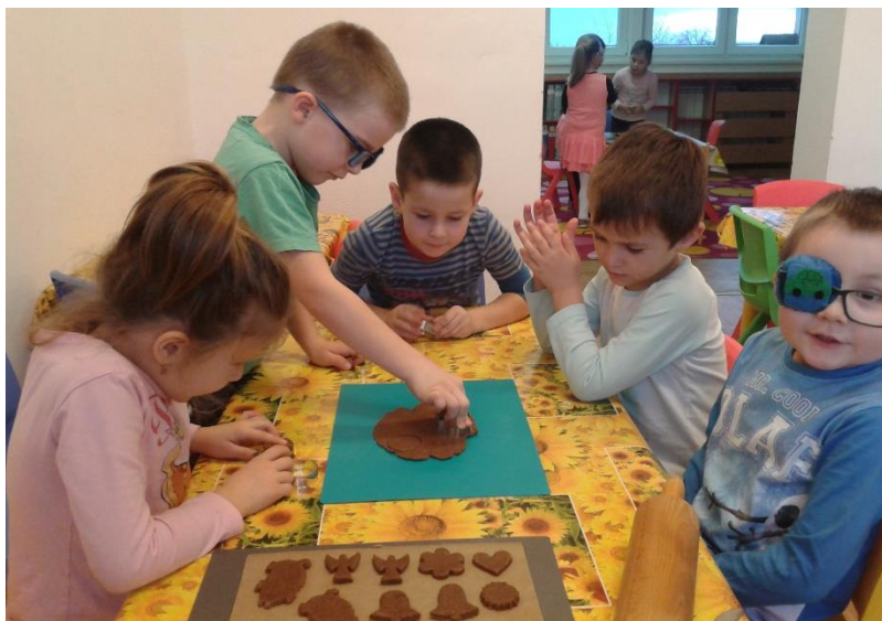
Školní výdejna na odloučeném pracovišti při vánočním tvoření

Školní jídelna pracuje s programem Fa ULRICH s.r.o., přihlášky a odhlášky obědů jsou prováděny přes systém EDOOKIT.