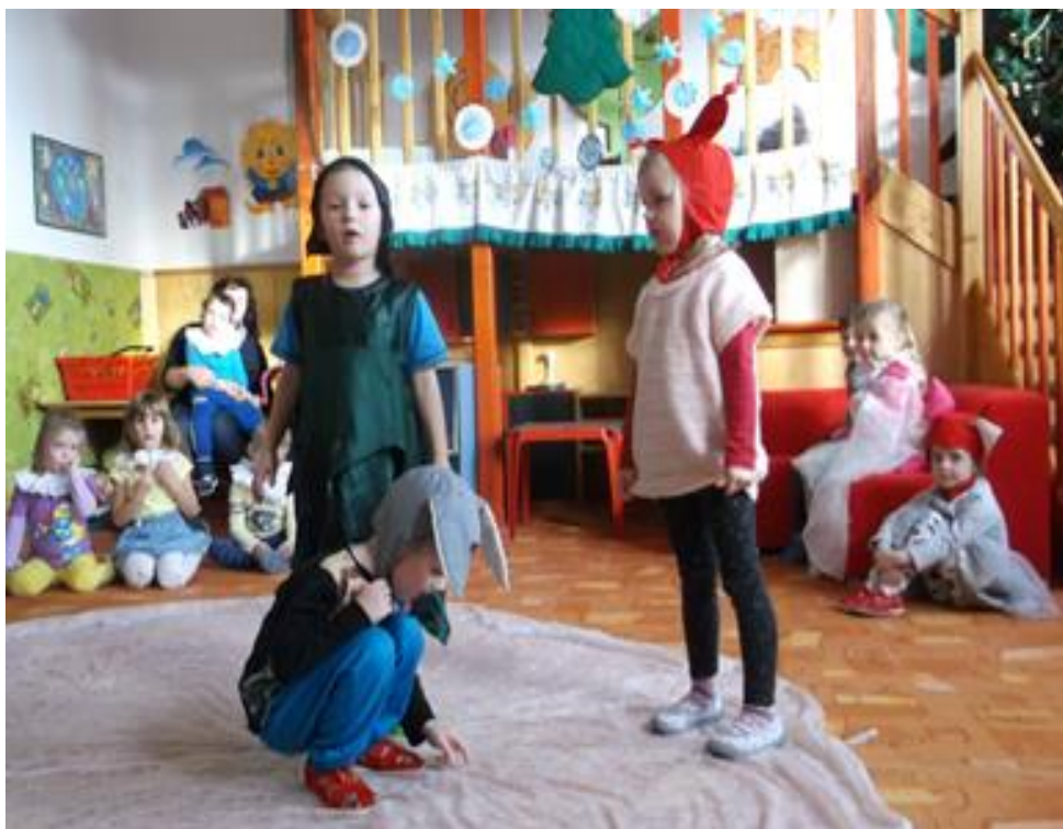
Pohádka o zimě a zvířátkách