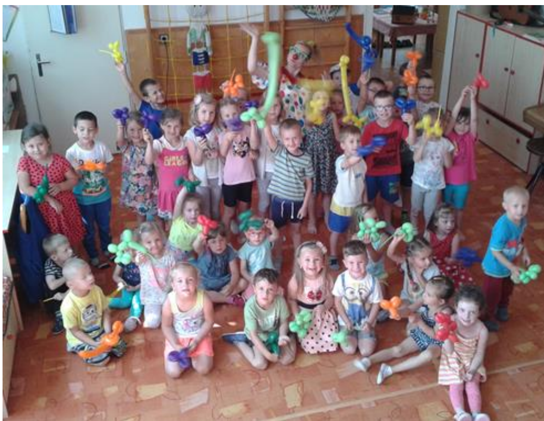
S klaunem oslavujeme Den dětí