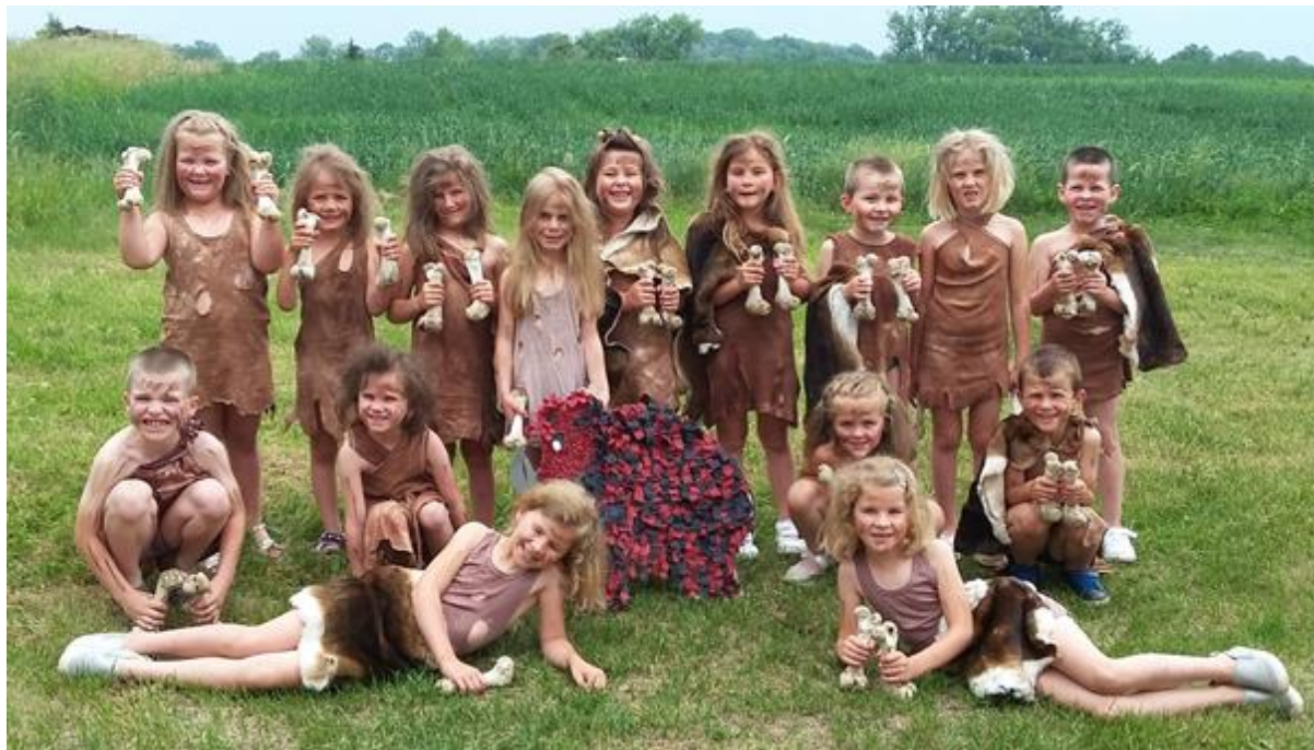
Oslavy 90. výročí školy