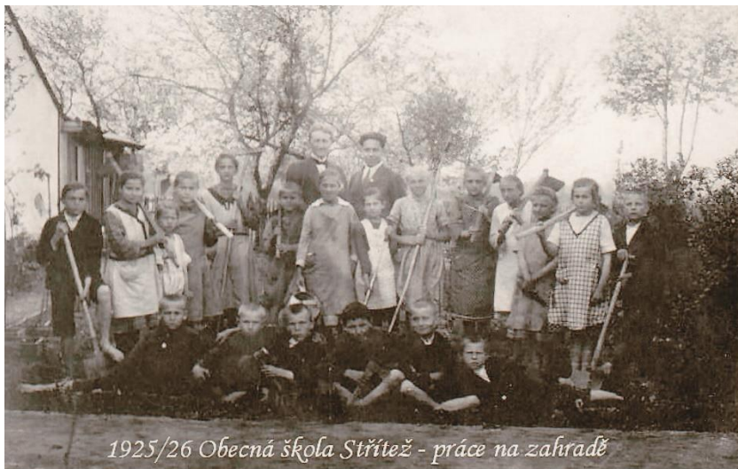
1925/26 Obecná škola Střítež - práce na zahradě

Největší časový prostor jsme ve školním roce 2017/2018 věnovali „pátrání“ po historii školy. Měli jsme k tomu velkou motivaci, neboť škola v roce 2018 slaví 90. výročí svého založení. Žáci zažili mnoho zajímavých projektových dnů a aktivit, aby nahlédli do pomyslného