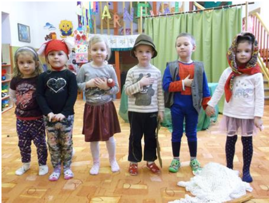
Adventní vystoupení dětí pro rodiče