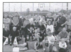
Volejbalový turnaj počtvrté.