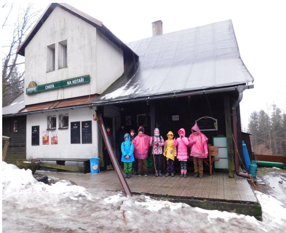
Výšlap na Kotář