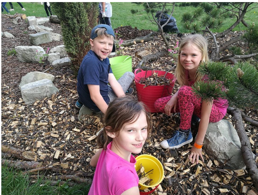
Otvírání školní zahrady