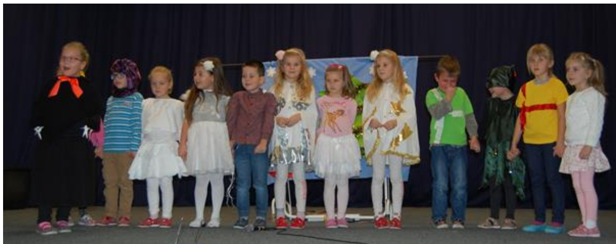
Adventní vystoupení dětí v KD Střítež