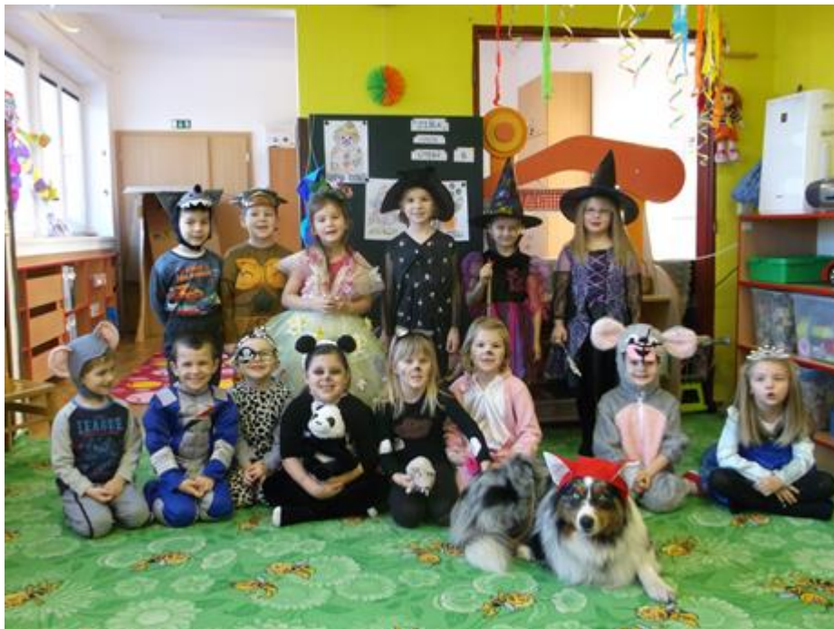
Maškarní den dětí a pejska