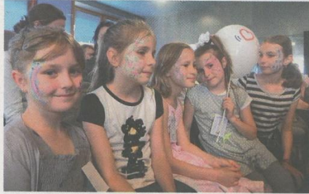
Zpěvačky se na svá vystoupení připravily nejen po pěvecké stránce.

tovat, že i po této stránce roste a vytváří zpěvákům kvalitní záze- mí a hostům příjemné prostředí. Není to samo sebou, za vším stojí tým ochotných zaměstnanců strítěžské základní školy a rodičů je-