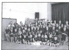
Příměstský tábor ve Stříteži.