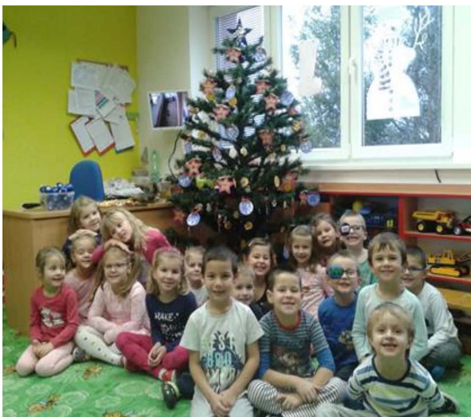
Vánoční chvíle u stromečku