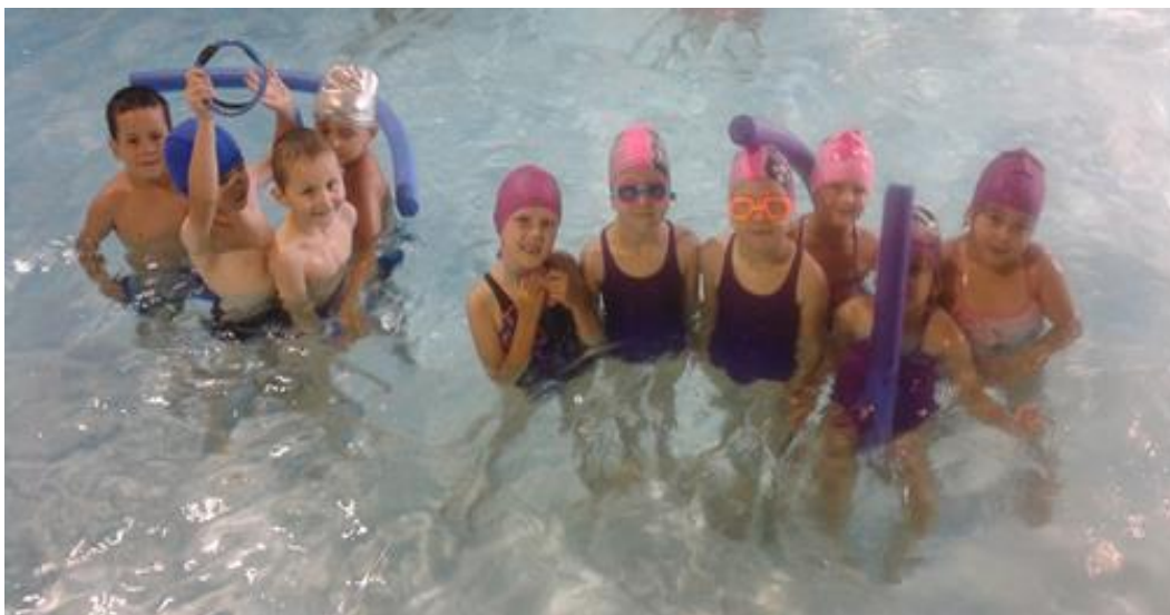
Učíme se plavat.....