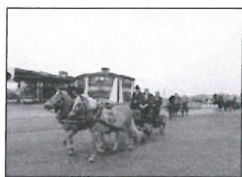
Dožínky v H. Tošanovicích.